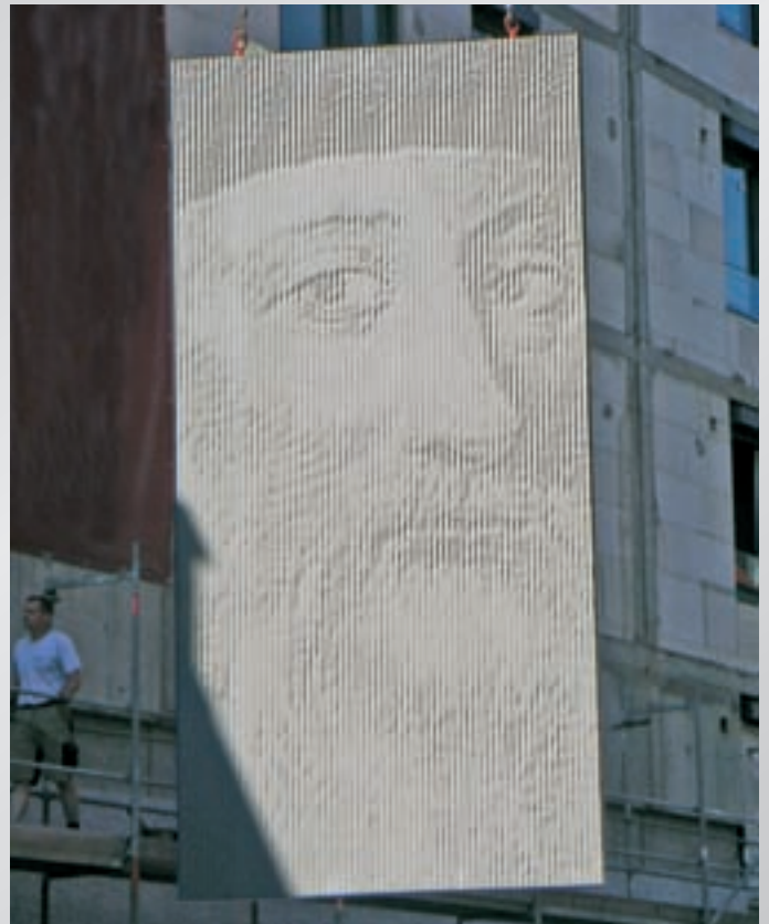
Betonelement für die „Gutenberghöfe“, Heidelberg Concrete panel for the „Gutenberghöfe“, Heidelberg Élément béton pour la „Gutenberghöfe“, Heidelberg